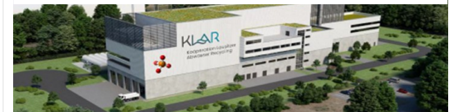
Phosphorrecycling aus Klärschlamm