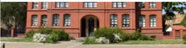
Pflegeschule Forst (Lausitz)