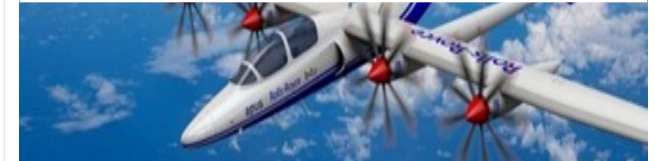
CHESCO – Zentrum für hybridelektrisches Fliegen