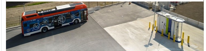
Wasserstoffbusse und Tankstelle Cottbus