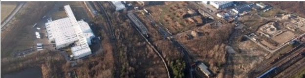
Gewerbegebiet IGG "Am Spreewalddreieck"