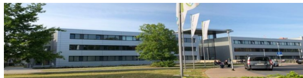
Digitalisierung des CTK Cottbus