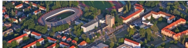
Olympiastützpunkt – Sportzentrum Cottbus