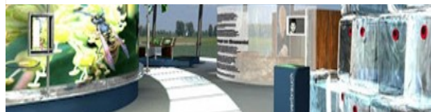
Infozentrum Wasserreich Spree