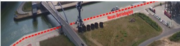
Ladegleis Königs Wusterhausen