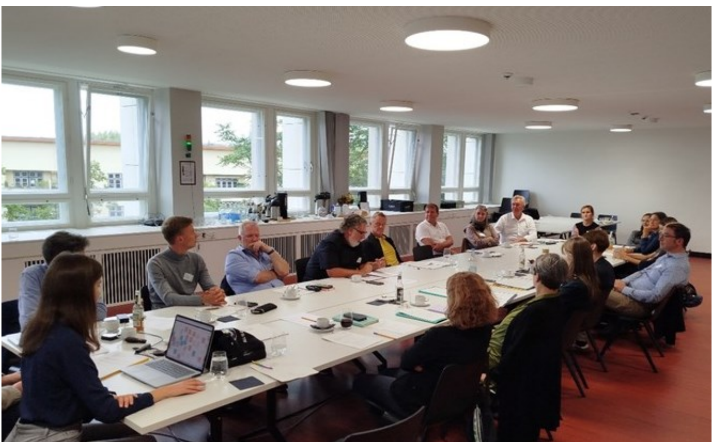
Einführung & Vorstellung der Instrumentenansätze im Plenum

Die Teilnehmenden diskutierten in diesem Rahmen die entwickelten Schwerpunkte und Instrumentenansätze entlang definierter Leitfragen zu deren Wirkungsgrad, Rechtssicherheit, Ressourcenerfordernissen und institutionellen Verankerung. Zudem fand eine Priorisierung der Instrumente durch die Teilnehmenden und damit eine Fokussierung zur weiteren Ausarbeitung der Instrumentenansätze statt. Als Diskussionsgrundlage dienten die Steckbriefe für 13 Instrumentenansätze, die den Teilnehmenden vor Ort präsentiert sowie ausgehändigt wurden.