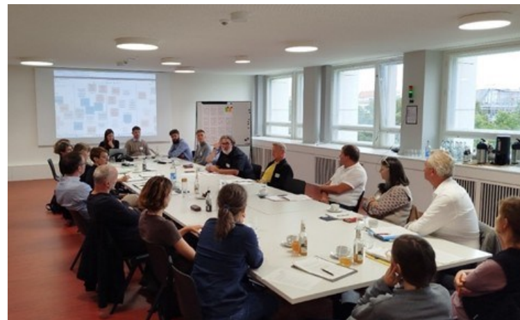
Diskussion der Ergebnisse im Plenum

Den Abschluss bildeten die Präsentation und gemeinsame Diskussion der Ergebnisse im Plenum, verbunden mit einem Ausblick auf die nächsten Schritte im Projekt. Die erarbeiteten Resultate werden für die Ableitung übergreifender Handlungsfelder sowie zur entsprechenden Überarbeitung und inhaltlichen Konkretisierung der Instrumentenansätze mit herangezogen.