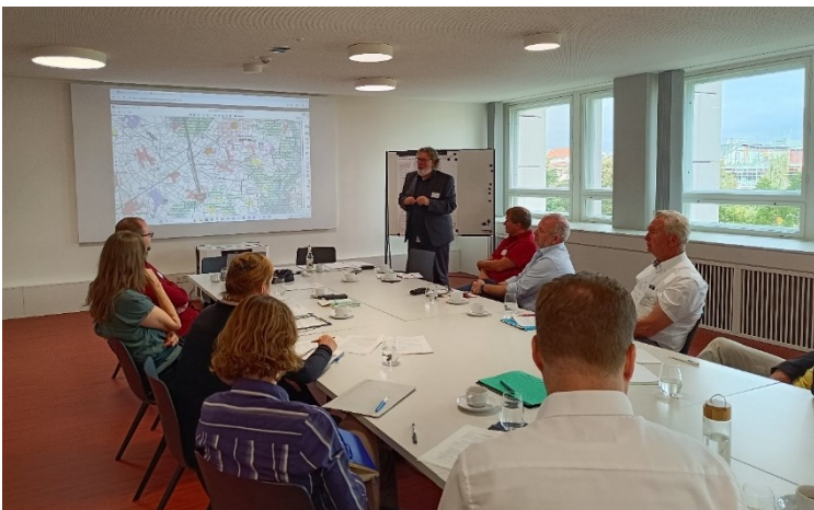
Arbeitsphase in den beiden Gruppenräumen

diente zunächst der weiteren Qualifizierung der Instrumentenansätze. Nach einer Einordnung des Planspiels in den Prozess des MORO-Projektes und einem kompakten Input zu den inhaltlichen Schwerpunkten der Instrumentenansätze im Plenum wurden die Teilnehmenden in zwei gemischte Gruppen aufgeteilt. Diese bearbeiteten jeweils unterschiedliche Instrumentencluster und Instrumentenansätze anhand der vorbereiteten Leitfragen. Der Fokus der Diskussion lag hierbei auf Pro und Contra sowie inhaltlichen Ergänzungen und Konkretisierungen. Die Ergebnisse beider Gruppen wurden anschließend im Plenum gespiegelt und gemeinsam diskutiert. Zum Abschluss wurde mithilfe von Klebepunkten die Bedeutung der Instrumentenansätze für das übergeordnete Ziel des Projektes „Mit Unterstützung der Raumordnung mehr Wohnraum ermöglichen“ durch die Teilnehmenden eingeschätzt.